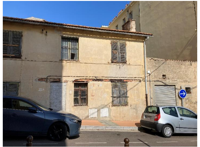
Diagnostic terrain du potentiel foncier avec les logements vacants